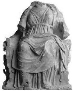
Μητέρα των θεών

Παρατήρησε προσεκτικά τα γλυπτά από όλες τις πλευρές και προσπάθησε να βρεις τα ιερά ζώα των θεών.